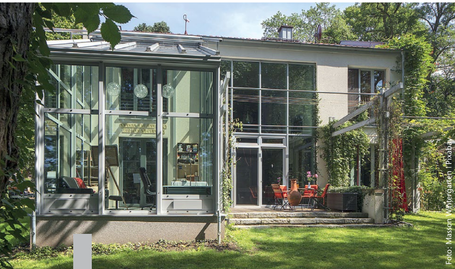
Ein Raum unter Glas bietet in der kühleren Jahreszeit jede Menge Spielraum.

Ein Wintergarten ist ein Gewinn an Lebensqualität – aber längst kein Luxus mehr. Er bietet mehr Lebensraum und ist ein Beitrag zum Energiesparen. Nach Norden ausgerichtet bietet er ganztags mildes Licht, nach Osten lässt er die Morgensonne auf den Frühstückstisch scheinen, im Westen verlängert er sonnige Abendstunden. Die meisten Eigentümer wählen jedoch – wenn irgend möglich – die Südseite. Dort wirkt der Wintergarten als Wärmepuffer im Sommer und als zusätzliche Isolierung gegen Kälte im Winter. In Wohnwintergärten kann eine elektronische Klimasteuerung für Wohlfühlklima sorgen. Die Anlage regelt die Luftfeuchtigkeit und die Temperatur, steuert die Heizung und die Lüftung. Moderne Mehrfachverglasung minimiert den Energieverlust. Zusätzlich gibt es Glas, das vor Lärm oder UV-Strahlen schützt, das sich selbst reinigt oder bruchfest ist. Ganzjährig bewohnbare Wintergärten sind ab etwa 15.000 Euro zu haben, individuelle Konstruktionen können ein Vielfaches kosten.