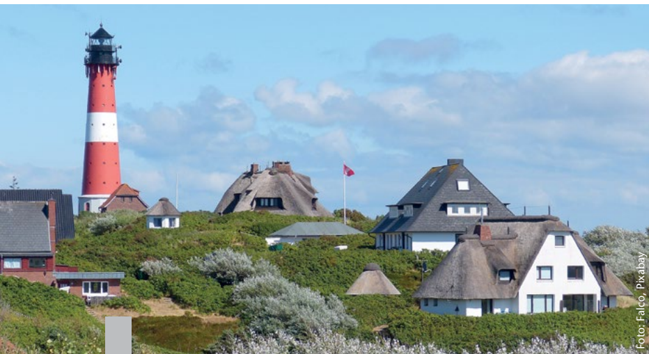
Die Ferienvermietung an den schönsten Orten Deutschlands – wie hier in Hörnum auf Sylt – ist ein wesentlicher Teil der Wertschöpfung.

Der inländische Tourismus hat im Jahr vor der Coronakrise 124 Milliarden Euro erwirtschaftet und damit vier Prozent der Wertschöpfung Deutschlands. Die Jahre 2020 und 2021 waren, bedingt durch die Coronapandemie, die umsatzschwächsten seit Beginn der Zählung im Jahr 1994. Vor der Pandemie im Jahr 2019 gaben Reisende für touristische Waren und Dienstleistungen innerhalb Deutschlands noch 330 Milliarden Euro aus, 2021 waren es gut 40 Prozent weniger.