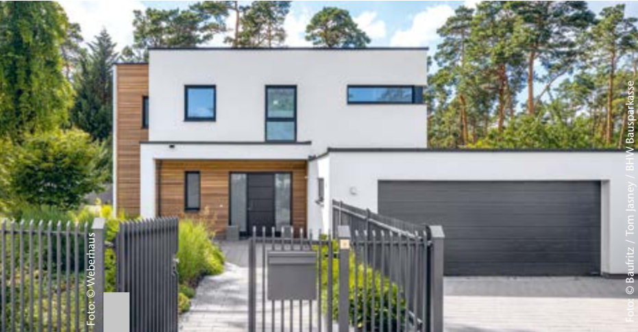
Ob Tiny House, Ein- oder Mehrfamilienhaus – industriell und seriell vorgefertigte Bauelemente vereinfachen, beschleunigen und verbilligen das Bauen.

Das Image von Fertighäusern hat sich deutlich gewandelt. Heute gilt das Prinzip der Vorfertigung als Schlüssel für eine intelligente Bauweise, die Ressourcen schon und viele Vorteile bietet. Vom Tiny House bis zum Bungalow wird serielles Bauen immer vielseitiger. Einer der Vorläufer des modernen Fertighauses ist das Fachwerkhaus. Die in der Werkstatt vorgefertigten Holzbalken wurden traditionell auf der Baustelle montiert und mit Lehm und Ziegeln ausgefacht. Heute werden Fertighäuser industriell vorgefertigt, das macht ihren Bau schnell und variantenreich. Ihre früher oft beanstandete Gleichförmigkeit ist individuellen Gestaltungen gewichen.