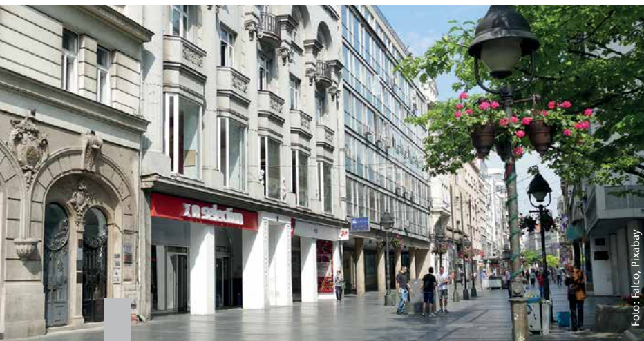
Bereits vor Corona herrschte in vielen Städten das Bewusstsein, dass eine Transformation der Innenstädte nötig sein würde.

Der Veränderungsprozess der Innenstädte hat schon vor einigen Jahren eingesetzt. In der Coronapandemie wird er deutlicher sichtbar: Die Verteilung des öffentlichen Raums in den Städten entspricht nicht mehr den Anforderungen an eine klimagerechte Stadt. Die innerstädtische Mobilität ist zu sehr am Leitbild des motorisierten Individualverkehrs ausgerichtet. Gewerbliche Nutzungen haben zu einem eintönigen Stadtbild geführt. Der Einzelhandel ist zu sehr durch Filialisten geprägt, die Gastronomie durch immer ähnlichere Imbissläden. Die Fußgängerzonen der 70er- und 80er-Jahre prägen wichtige Teile des Stadtbildes und wirken abends wie ausgestorben. Eine Aufwertung der Aufenthaltsqualität ist überfällig. Die Funktionalität der Innenstädte ist ein öffentliches Gut. Alternative Nutzungen spielen eine zentrale Rolle, um Innenstädte belebt zu halten. Die Umnutzung von Büroflächen könnte eine adäquate Möglichkeit sein, um bezahlbaren Wohnraum zu schaffen. Erdgeschosslagen eignen sich für kulturelle und soziale Nutzungen oder für neue Formen der urbanen Produktion. Die Stadt der Zukunft ist auf jeden Fall multifunktional.