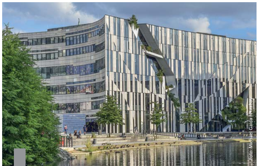
Mieter oder Eigentümer, die etwas an ihrer Wohnung verbessert haben, denken mit Stolz an ihr Zuhause und sind meistens auch glücklich damit.

Wie sich die deutschen Wohnimmobilienmärkte im Jahr 2019 darstellen, zeigt eine aktuelle Untersuchung. Die Preise und Mieten für Immobilien stehen weiterhin unter dem starken Einfluss der anhaltenden Urbanisierung, knappen Baulands und einer hohen Nachfrage. Der stärkste Mietanstieg erfolgte in den sehr guten und mittleren Wohnlagen der sieben Städte Frankfurt, Köln, Düsseldorf, München, Berlin, Hamburg und Stuttgart.