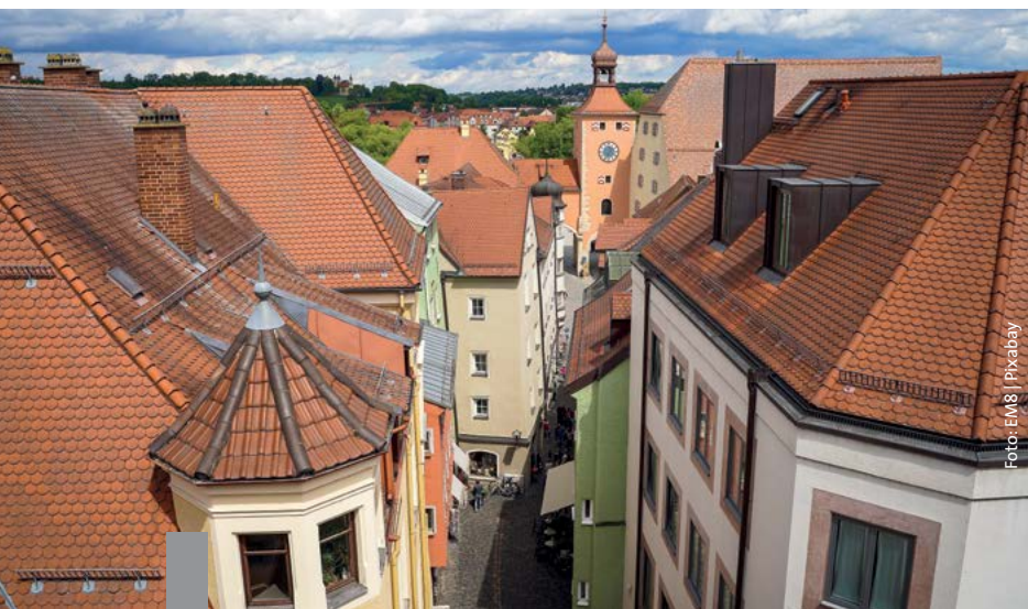
Unter den Dächern der Städte schlummern noch große Wohnraumreserven.

Der Bundestagsausschuss für Bau, Wohnen und Stadtentwicklung hat in einer Anhörung verschiedene Experten zum Thema Dachausbau befragt. Dieser wird als Chance gesehen, in Städten zusätzlichen Wohnraum zu schaffen. Dazu sind Änderungen des Baurechts in der Diskussion – von einer Genehmigungsbefreiung für einfache Aufstockungen bis hin zur Zulässigkeit einer Überschreitung der erlaubten Geschossflächenzahl ohne Ausgleichsmaßnahmen. Denkbar ist auch eine Befreiung von der Pflicht, Stellplätze zu schaffen. Auch umfangreiche neue Förderprogramme durch die KfW wurden ins Gespräch gebracht.