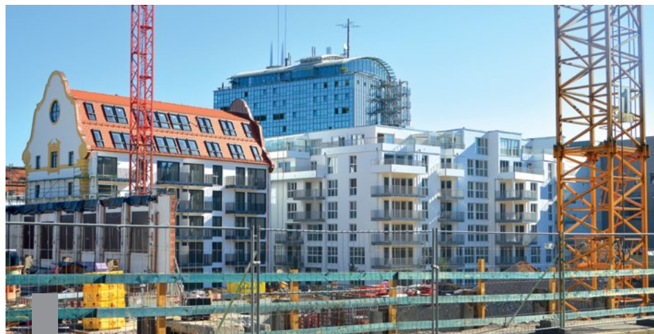
Geld gibt es in der Niedrigzinsphase genug. Gewinnbringende Geldanlagen sind dagegen so rar wie Wohnungen.

Eine Analyse von Immowelt.de hat langfristige Anlageformen untersucht, darunter den Immobilienkauf in den 14 größten deutschen Städten. Zugrunde gelegt wurde der Preis einer Wohnung mit 80 bis 100 Quadratmetern inklusive Nebenkosten, Zinsen und Rücklagen für Reparaturen. Mieteinnahmen wurden mitgerechnet. Analysiert wurde die Wertentwicklung mit einem Eigenkapitalanteil von 30.000 Euro über zehn Jahre. Der Vermögenszuwachs war bei Immobilien in 11 der 14 untersuchten Städte größer als bei anderen Anlageformen. Immobilien in München, Hamburg und Frankfurt führen das Ranking an. In München betrug der Gewinn 283.900 Euro, in Hamburg 173.000 Euro und in Frankfurt 162.300 Euro. Anleger, die Gold kauften, verbuchten dagegen nur ein Plus von 29.100 Euro, 10-jährige Bundesanleihen brachten 12.000 Euro. Das Sparbuch bildete das Schlusslicht mit einem Plus von 3.600 Euro. DAX-Fonds waren mit einem Plus von 44.800 Euro auch lukrativ, lagen aber deutlich hinter dem durchschnittlichen Gewinn von Immobilienkäufern.